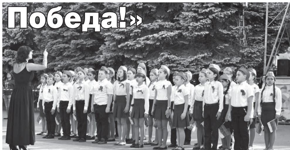
Школа №2, младший хор