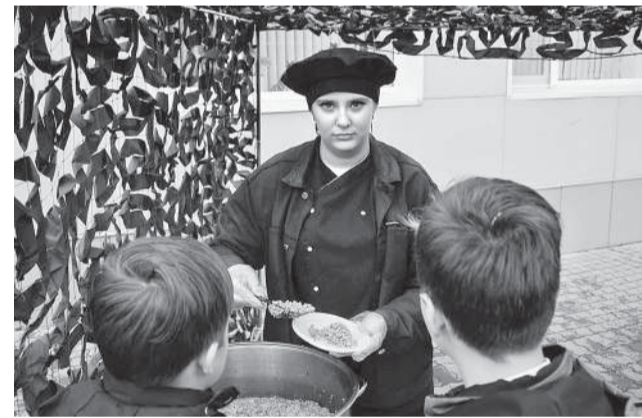
Бивак повара в гимназии №21