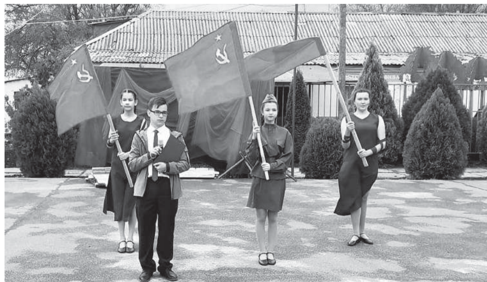
9 мая в школе №6 работала творческая площадка «Салют Победы»

дедушка - участник Великой Отечественной войны» и заняла первое место по Российской Федерации!