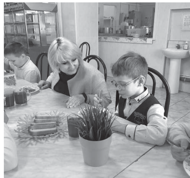
Завтрак с директором в школе №6

- За прошедший учебный год особых замечаний у нет. С началом учебного года поступило одно обращение от родителей, в котором говорилось, что еда подается не горячей. Обращение было рассмотрено, взято на контроль, мы приобрели специальный термометр, и все блюда подаются горячими, - прокомментировали в школе №12.