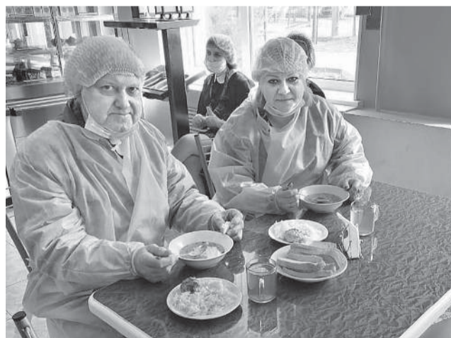
Родительский контроль в школе №8

- Конечно, не все блюда равнозначно нравятся детям. Но практика и проведенное анкетирование показали, что любимыми стали сосиска с макаронами, плов с курицей, вареная колбаса с гречкой. Чаще всего учащиеся отказываются от блюд с печенью и рыбой. Они не привыкли к продуктам, которые приготовлены на пару, хотя именно такой способ приготовления блюд наиболее полезен, сохраняет полезные вещества продуктов, - поделились информацией в школе №2.