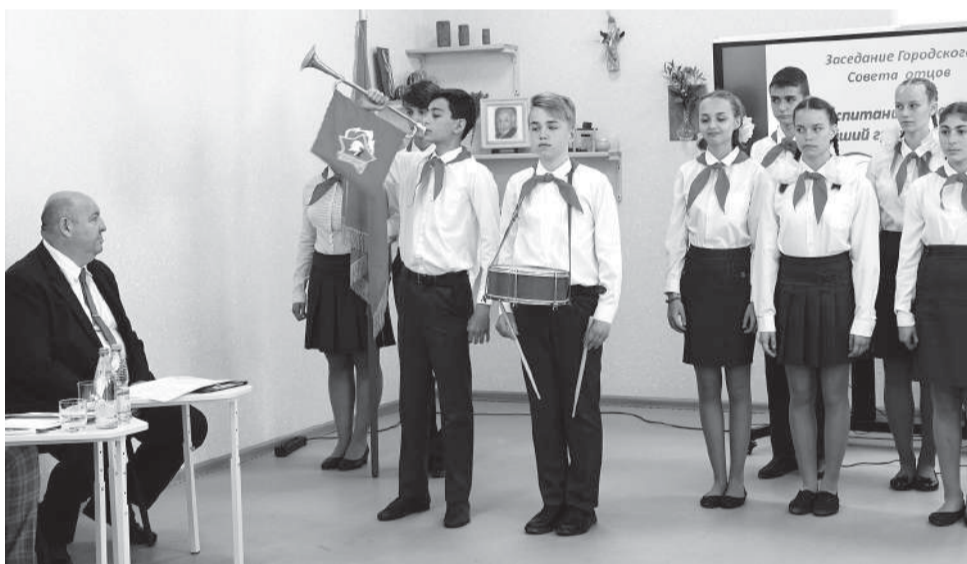
Лицей №10 блестяще исполнил песню и рассказал об истории пионерского движения

На экране юная пара на скутере, фары которого не работают, шлемов нет.