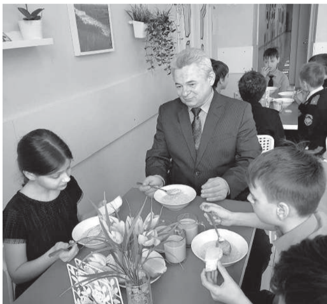
Директор начальной школы №1 контролирует питание в столовой

Начальная школа №1 в середине учебного года оказалась в центре неприятного инцидента, связанного с обилием гречки в меню. В ситуации разобрались, с поварами вопрос решили, а меню пересмотрели.