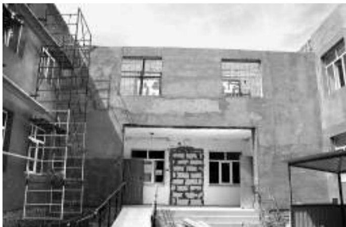
В ДОУ №19 подняли стену балкончика и делают там два полноценных кабинета

Детский сад №19 1986 года постройки. Раньше он принадлежал 258-му ремзаводу, но в 90-е долго был «неприкаянной душой», переходя от одной военной части к другой. Наконец, в 2004 году сад забрали в муниципальную собственность. Он ни разу не ремонтировался капитально, только косметически и, конечно, за 34 года сильно устарел.