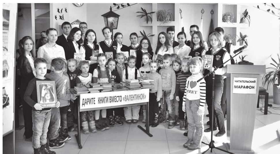
Добровольчество очень развито в школе №16, отряд «Сила поколений» – в числе лучших в Батайске