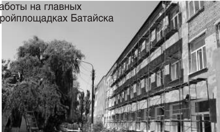
Фасадные работы в школе №5. Рабочие не только наводят внешнюю красоту, но и укрепляют конструкцию здания

– Очень востребованные группы для малышей такого возраста, родители уже ждут, – продолжила Евгения Викторовна. – Кроме того, мы полностью перепла-