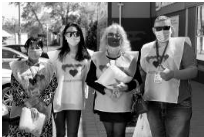
Больше 100 батайчан откликнулись на призыв стать волонтерами во время пандемии