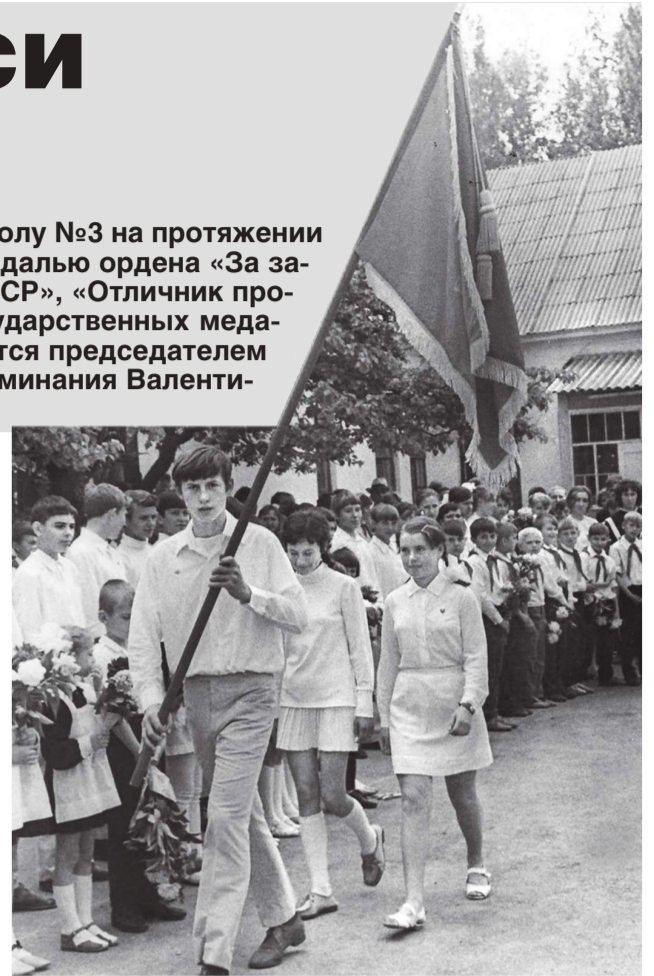
Вынос знамени школы

В качестве первого шага ребят знакомили с предприятием, рассказывали, какую продукцию производит завод, какое