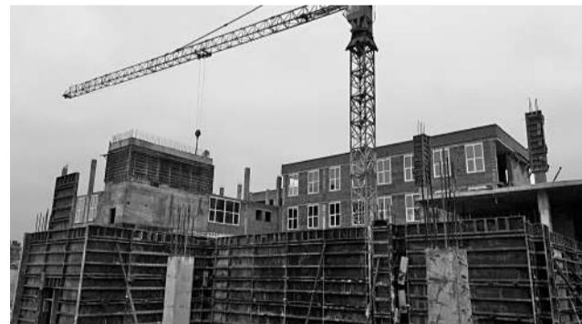
Подрядчик увеличил количество рабочих и техники на строящемся объекте — школе на СЖМ

Что касается текущего строительства школы на СЖМ, то здесь пришлось оштрафовать подрядчика на 1,2 млн рублей — по итогам прошлого года застройщик не выпол-