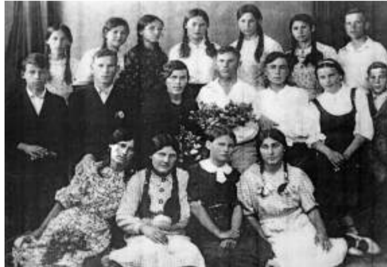
Выпуск 7-го класса. 1941 год