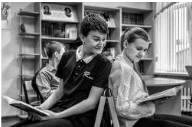
Однажды на перемене. Фоторабота Ивана Андрианова

Всего на конкурс прислали 43 фотографии от 12 школ Батайска. Тут сразу хотелось бы заметить, что встречались явно профессиональные обработанные фотографии с фотосессий! Оцениваются, в первую очередь, талант и креатив отдельного школьника, а вовсе не профессионального фотографа!