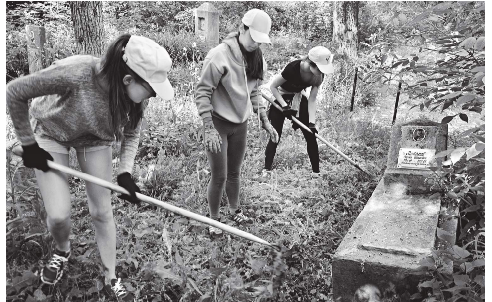
Могила героя в Батайске - школьники устроили субботник

ступление советских войск под Сталинградом, закончившееся окружением и разгромом фашистских войск. Радость Сергея и его боевых друзей была безмерной.