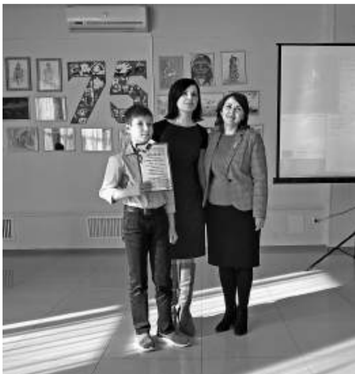
Семья Трекиных, школа №5, дипломанты 1 степени